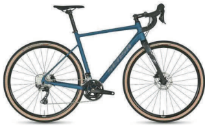
Sensa Romagna Gravelbike

5 binnenbanden voor de racefiets 50 of 60mm ventiel 10 euro !!! = 1 tientje per 5 !!!