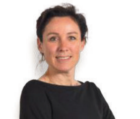
COLUMN MARIJN DE VRIES

R egelmatig breng ik mijn kinderen op de racefiets naar school. Zij op hun eigen fietsjes, en ik in wielertenu. Klinkschoenen, broek met zeem, en helm. Kan ik meteen doorfietsen als de school begint. Wel zo efficiënt. Ik breng de meiden naar binnen, de een naar de kleuters en de ander naar groep drie. Omdat ik vaak een fietstenu draag, denk ik er eigenlijk niet bij na dat het misschien wel wat ongewoon is om zo door de school te lopen. Voor sommige ouders zal ik vast die rare moeder met die helm zijn. Die gekke fietsmevrouw.