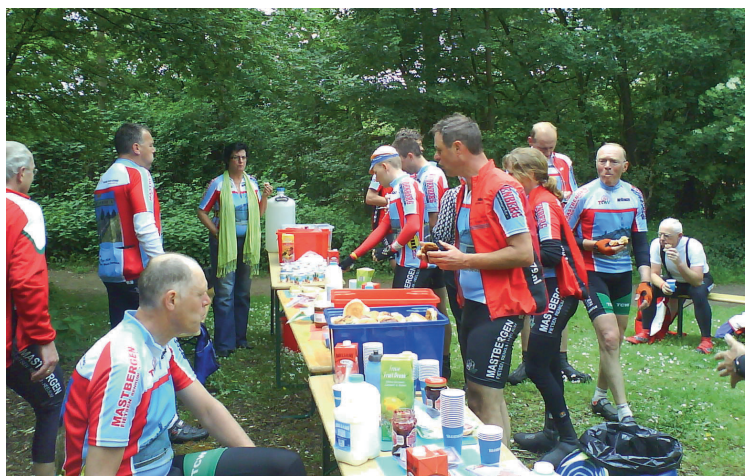
Een lunch tijdens de vorige Mont Ventoux-tocht (2009)